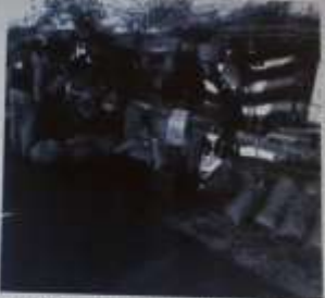
Après plus de 100 ans de culture, les figes de Béni Maouche ont obtenu un label spécifique. On les trouve dans les magasins de la région. Ici, on les voit à la vente lors de la fête de la figue. Les producteurs de Béni Maouche ont obtenu un label spécifique. On les trouve dans les magasins de la région. Ici, on les voit à la vente lors de la fête de la figue.